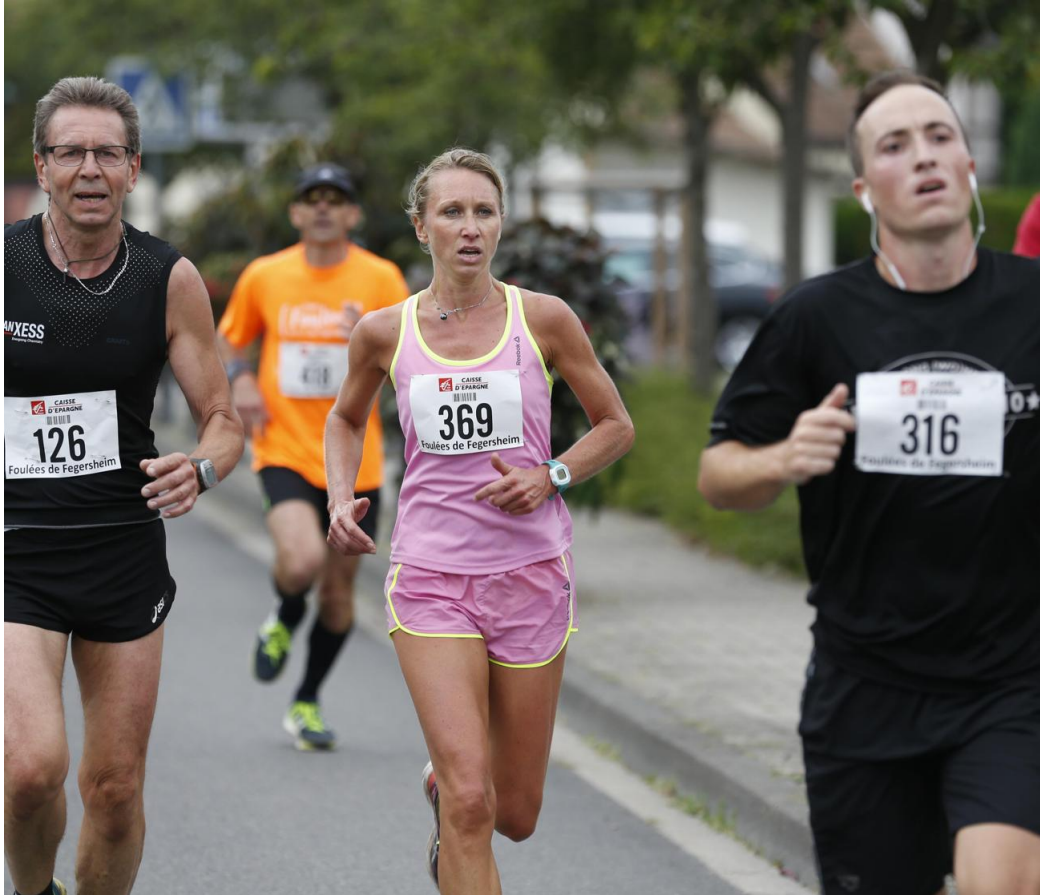
Parmi les 328 athlètes qui franchiront la ligne d'arrivée du 10km, ou plutôt 10,2 voire même 10,3km.