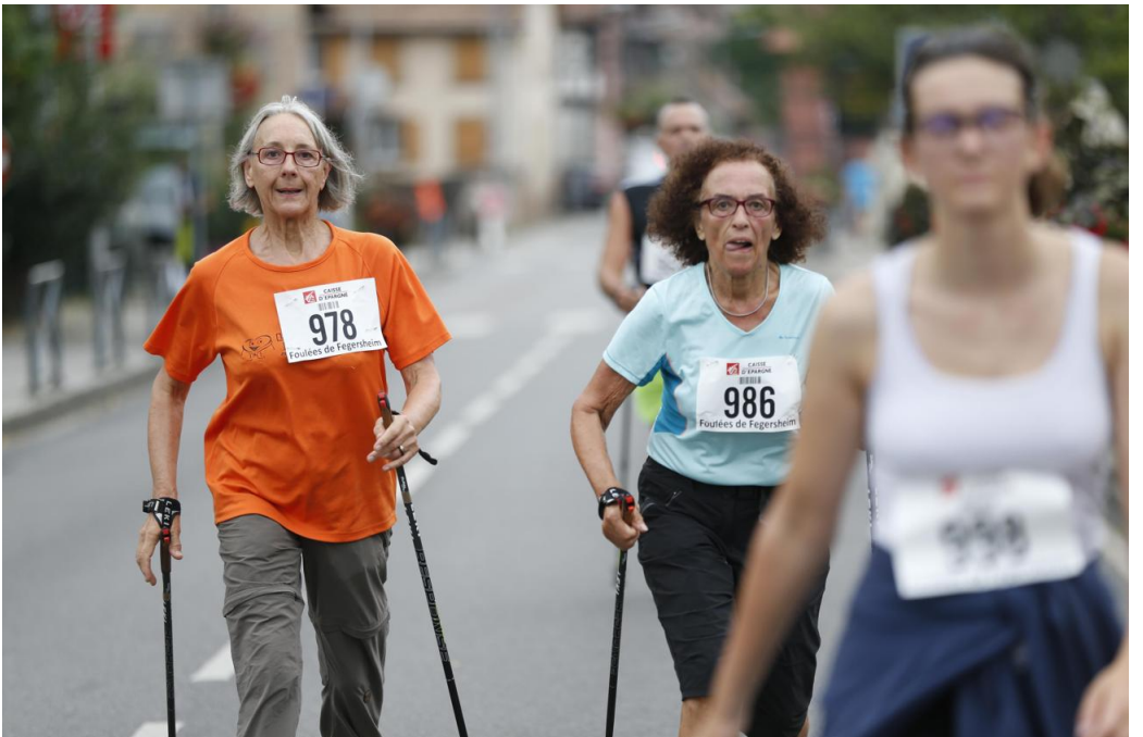
35 adeptes de la marche nordique ont bouclé ces foulées 2016.