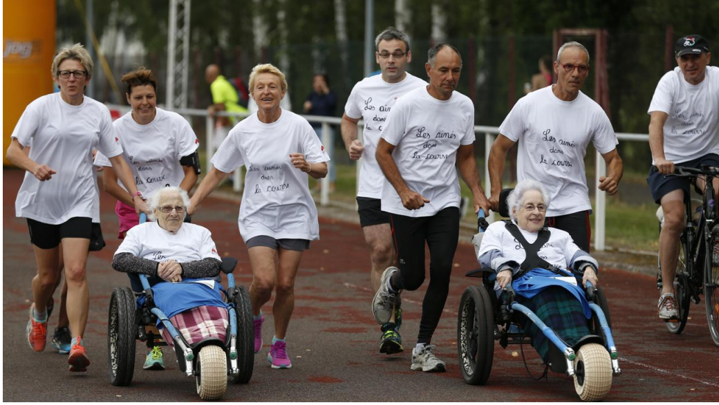
C'est écrit : les aînés dans la course. Coup de chapeau!